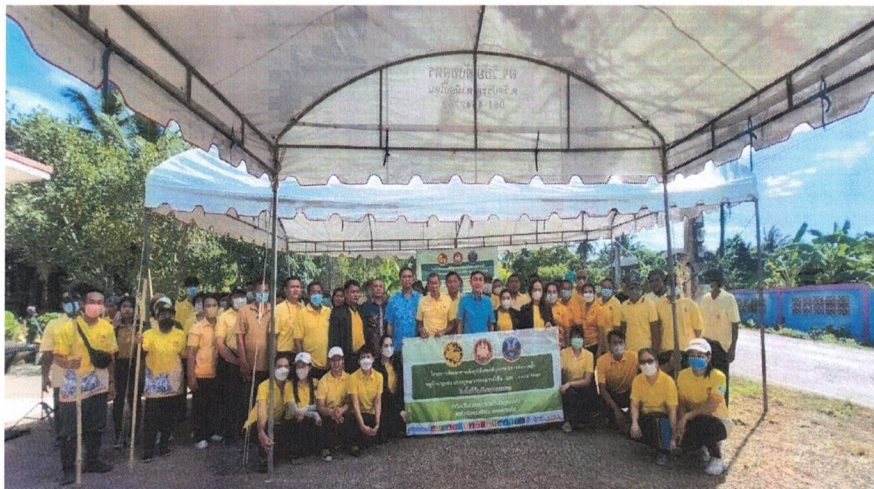
กิจกรรมโครงการเยาวชนบางแคมีทักษะคุ้มกันเอเด็ส